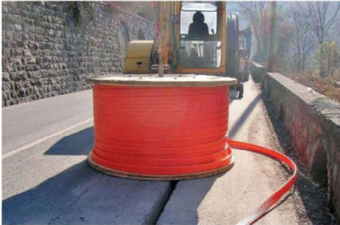
Banda ultralarga. Lavori per la posa della fibra ottica nel Bresciano